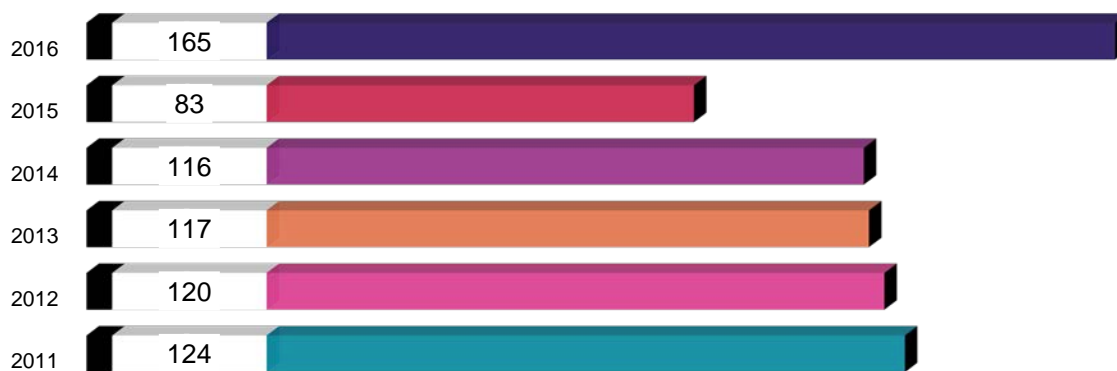
Controversias Constitucionales por año (2011 - 2016)

Fuente: Portal de Estadística Judicial @LEX